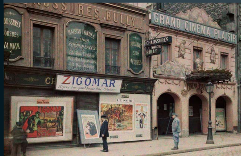
© Musée Albert-Kahn - Département des Hauts-de-Seine

Le Grand Cinéma Plaisir, rue de la Roquette. Paris, France, 14 mai 1918. Autochrome 9 x 12 cm, Auguste Léon, inv. A 14 056.